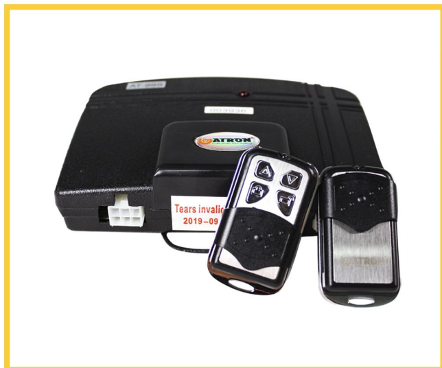
Kit Controle sem Fio AT99A