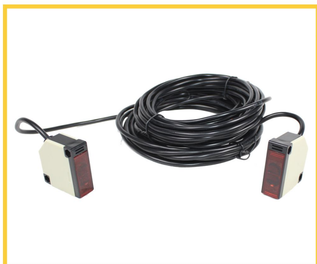
Sistema Infra Vermelho